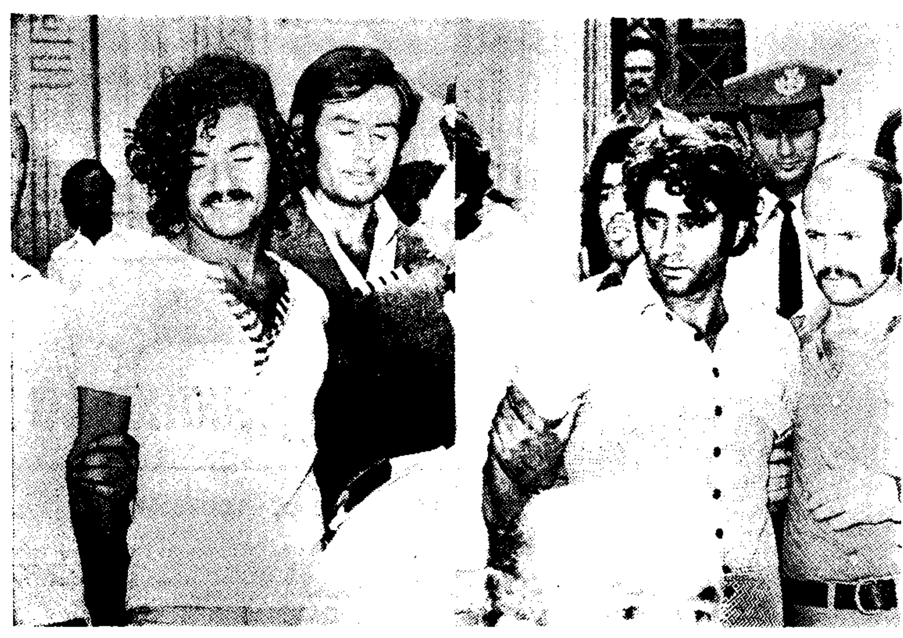
Χαουαλασσί, φάραχοι και ασυγκίνητοι, μπροστά στις αποδοκιμασίες και τις απειλητικές διαθέσεις του πλήθους...